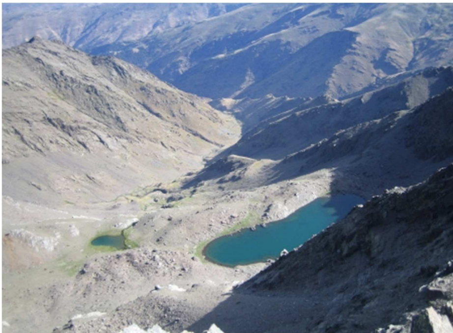
Laguna Larga y Gabata