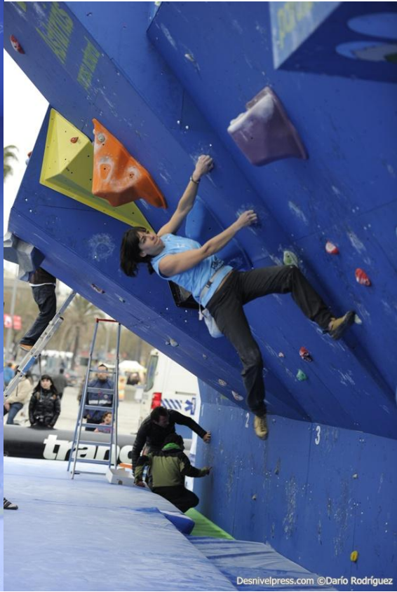
Tere en los bloques de la final.