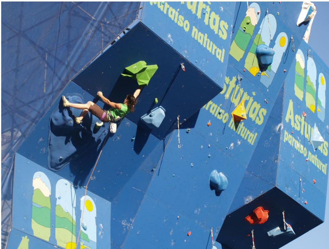
Tere en la vía de la final