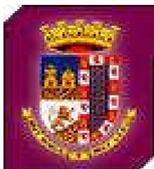
Ayuntamiento de Jumilla Concejalía de Deportes